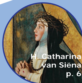
H. Catharina van Siëna p. 6