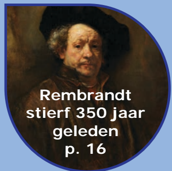
Rembrandt stierf 350 jaar geleden p. 16