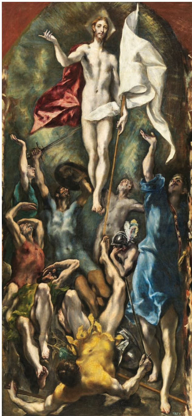
El Greco - De Verrijzenis

nieuwing van de doopbelofte eindigt de Paaswake met het vieren van de eucharistie. Niet als herinnering aan wat Jezus op het laatste avondmaal deed met zijn leerlingen, maar als een verrijzenismaal, waarbij de verrezen Heer die in ons midden is ons uitnodigt en zichzelf aan ons geeft opdat wij meer en meer zouden leven van zijn leven. De verrijzenis, Pasen, geeft aan de eucharistie zijn diepe betekenis. Of anders gezegd, wie gelovig met Pasen eucharistie viert zal ontdekken dat men in elke eucharistie steeds een beetje Pasen viert.