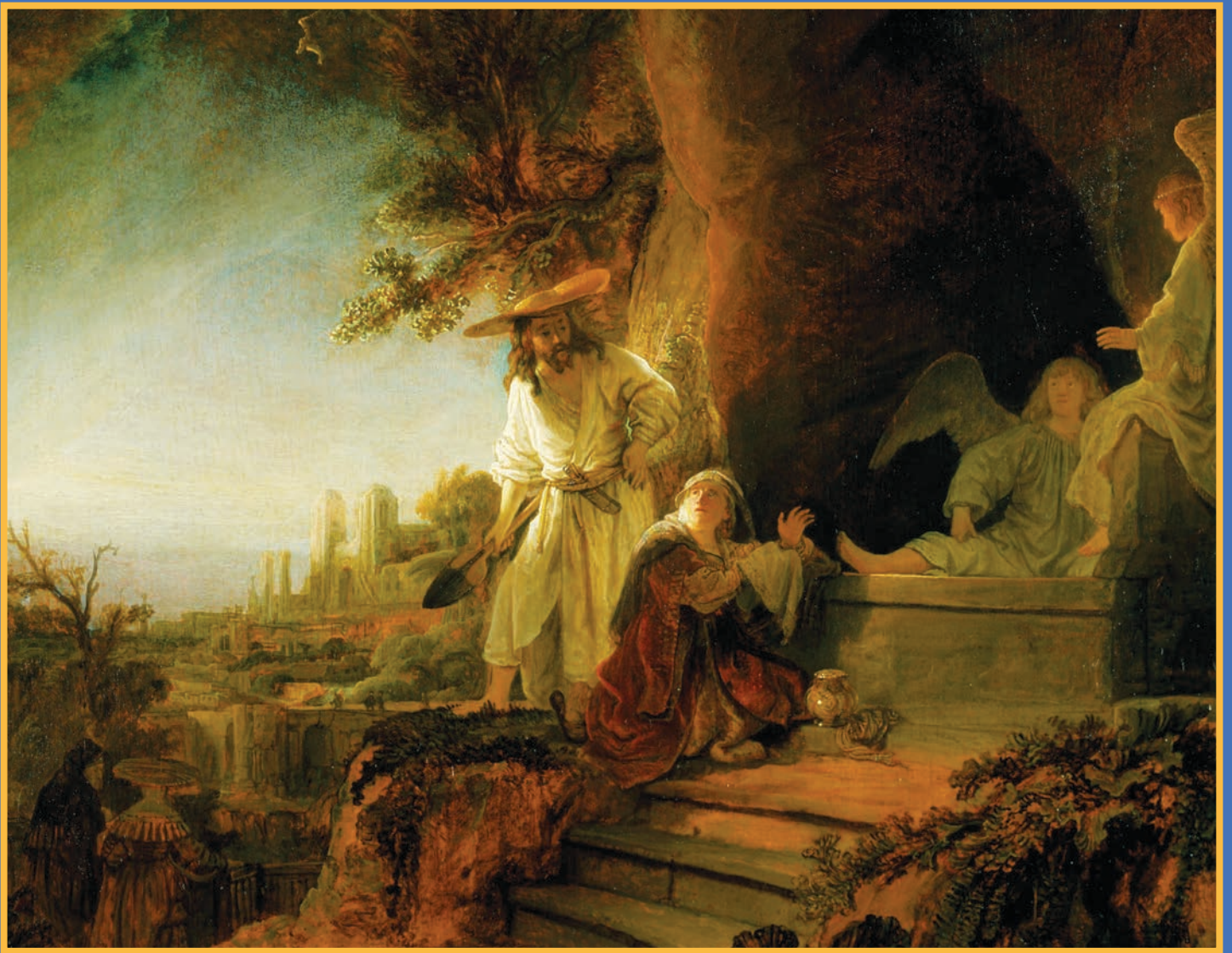
Rembrandt - De opgestane Heer verschijnt aan Maria Magdalena