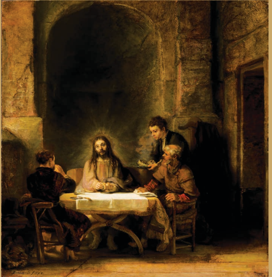
Paneel 68x65 - 1648 Parijs, Musée du Louvre