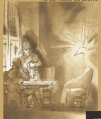
Pen-en-penseeltekening - 1648 Cambridge, Fitzwilliam Museum