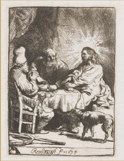
Ets 10,2 x 7,3 - 1634 Amsterdam, Rijksprentenkabinet