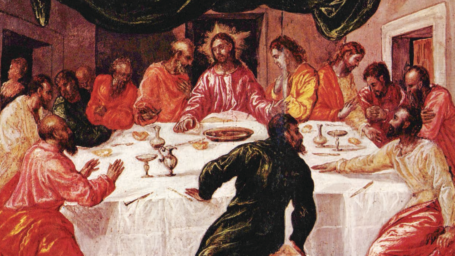
El Greco - Het laatste Avondmaal

onderstreept dat hij dit doet vanuit dienende liefde. In zijn gevangenneming in de hof van Oliven wordt duidelijk dat hij consequent die weg ook heel concreet gaat. De viering begint feestelijk met klokkengelui en jubelzang omdat door het laatste avondmaal Jezus ons de eucharistie gegeven heeft waardoor hij bij ons is en ons sterkt. Toch eindigt de viering ingetogen, omdat we horen vertellen van het verraad en de deemoedige zelfontleding van Jezus die zich overlevert aan mensenhanden. Daarom dat na het feestelijke 'Eer aan God' de klokken zullen zwijgen totdat we het opnieuw blij zullen zingen in de Paaswake omwille van Jezus' verrijzenis. Vanaf de viering van Witte Donderdag vergezellen we Jezus op zijn weg tot aan zijn Pasen.