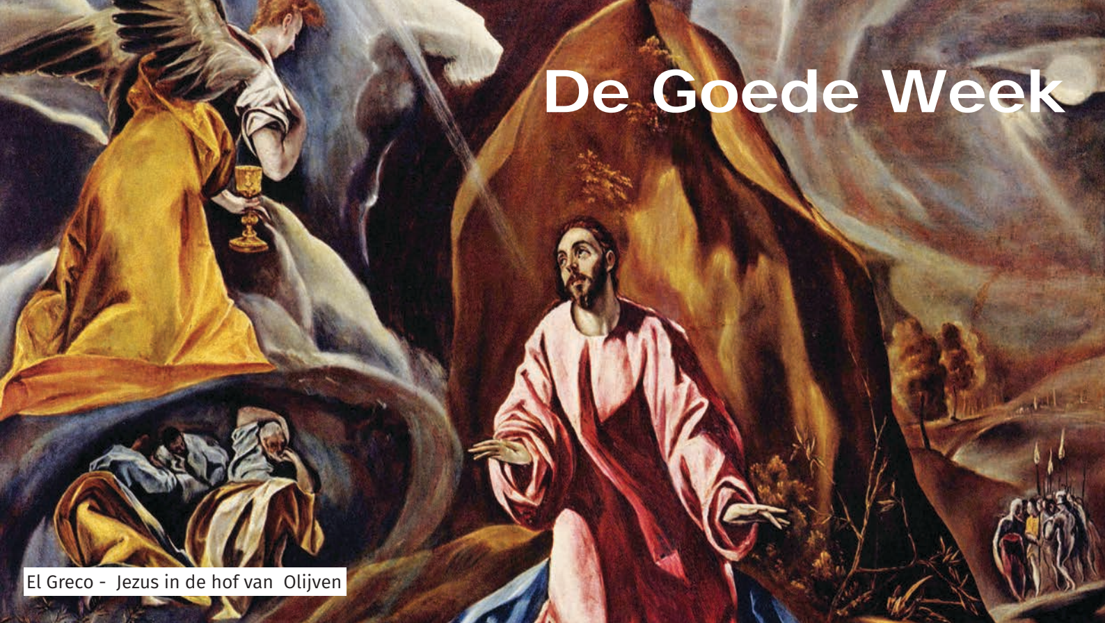
El Greco - Jezus in de hof van Olijven