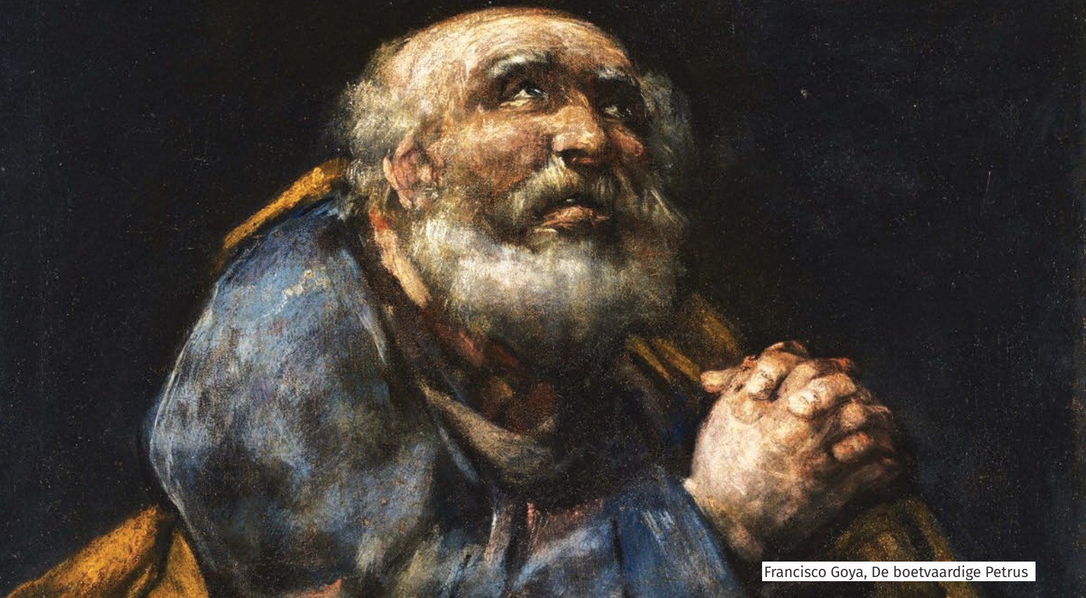
Francisco Goya, De boetvaardige Petrus