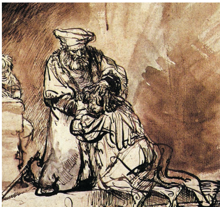
Rembrandt, De Barmhartige Vader

De biecht is in onze contreien een niet zo populair Sacrament. Het is vaak verwaarloosd. Hoe minder men echter de eigen zonden nagaat, hoe minder men er zich ook van bewust wordt dat men zondaar is. Zo komen velen tot de conclusie dat ze – zeker als ze geen grote zondaren zijn zoals moordenaars en dieven – eigenlijk geen zonden meer hebben. Tijdens de Vastentijd, in de laatste aanloop naar Pasen, geeft de Heer ons echter een vernieuwde uitnodiging om iets te ontdekken dat nodig is om als Christen te leven en zich te laten voeden door God. Iedereen heeft wel eens nood aan vergeving. De heilige Schrift zegt dat een rechtvaardige tot zevenmaal per dag zondigt. Misschien een gelegenheid om zelf ook de stap te zetten naar een biechtgesprek en zich zo vrij te maken van wat zo vaak een last is?