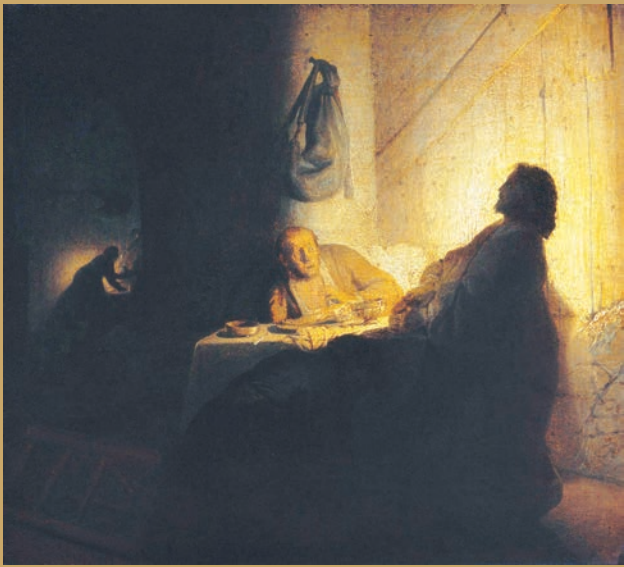
Papier op paneel 39x42 - 1628 Parijs, Musée Jacquemart-André