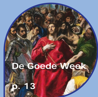
De Goede Week p. 13