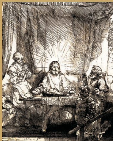
Ets 21,1x16 - 1654 Amsterdam, Rijksprentenkabinet