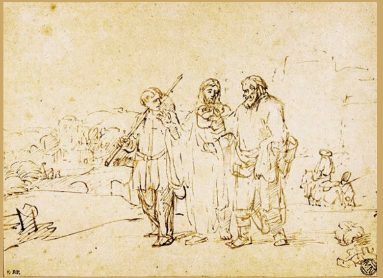
Pentekening 16,6x22,4 - 1655 Parijs, Musée du Louvre