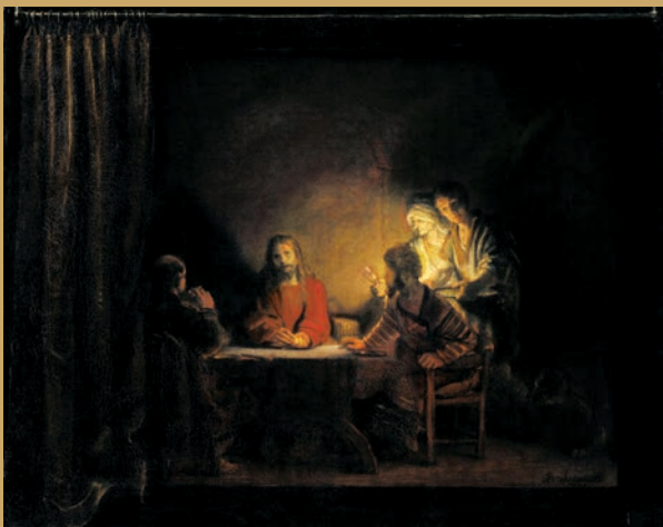
Doek 89,58x111,5 - 1648 Kopenhagen, Statens Museum for Kunst